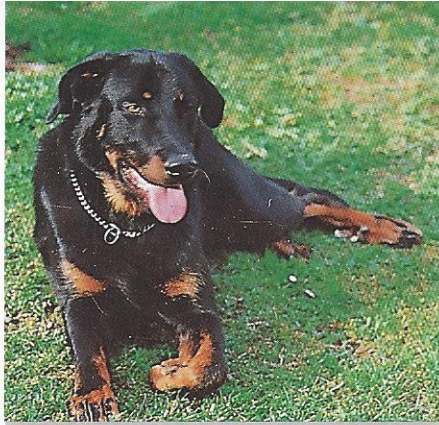
Arcon du Chasseur de Sangliers 13 Monate, Rüde, noir et feu