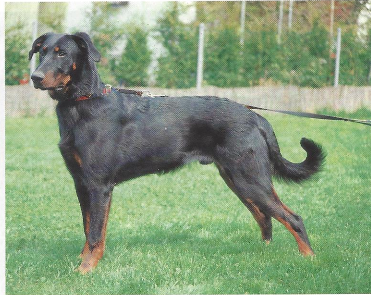
Der Chien de Berger de Beauce besticht durch sein kraftvolles Auftreten. (oben)

Schon sehr ausgeprägter, markanter Kopf eines erst acht Monate alten Berger de Beauce. (links)