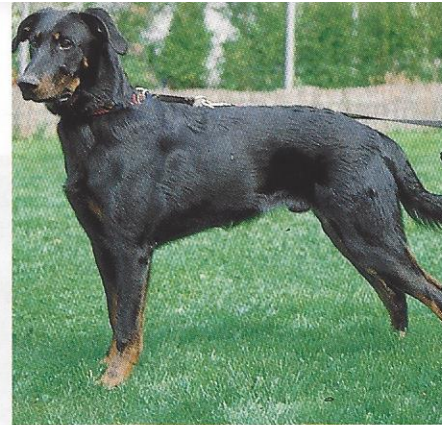
Kayenne vom Schweizerblick Acht Monate, Rüde, noir et feu