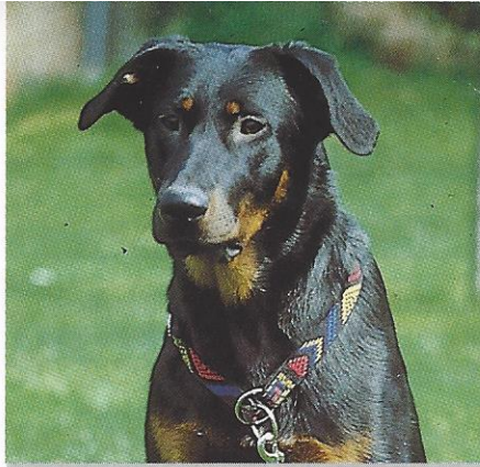
Chilli Acht Monate, Hündin, noir et feu

Er entfaltet sich besonders gut in der Familie. Der Umgang mit Kindern ist liebevoll, mit anderen Rüden gibt es Probleme.