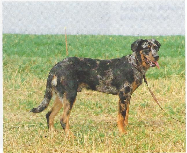
Ein Vertreter des seltenen Farbschlages Harlekin (arlequin). (unten)

ziehung eines solchen Hundes ist verschieden von der eines Briards. Den Matin muß man zum Kampf animieren.“